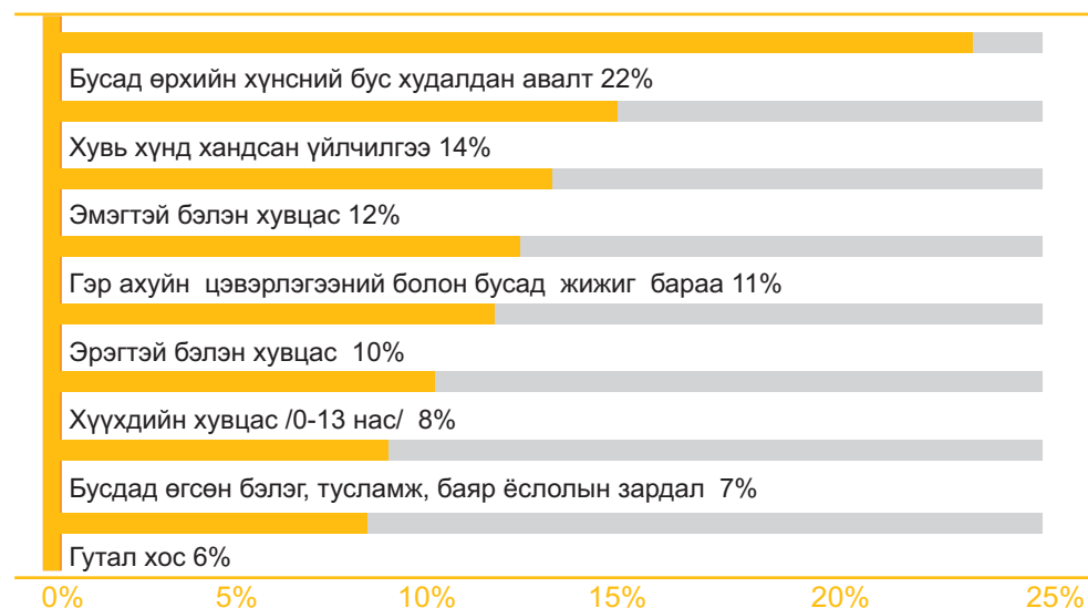
Эх сурвалж Өрхийн нийгэм эдийн засгийн судалгаа 2016 он

Хувцас загварын зах зээлд эмэгтэйчүүдийн худалдан авалтын давтамж болон худалдан авалтад зарцуулж буй мөнгөн дүн эрэгтэйчүүдийнхээс 1,2 дахин илүү байдаг онцлогтой.